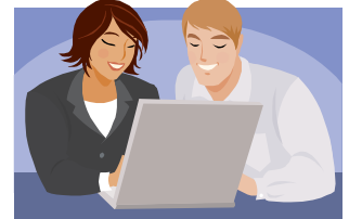
Servicios de Información