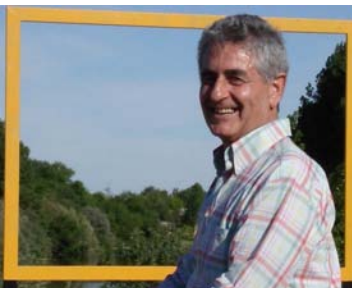
El recién nombrado Duque de Huerta en sus dominios del Parque fluvial del río Tormes. / Andrés Acosta González