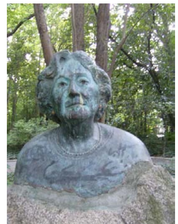
Busto de Rosa Chacel en el Campo Grande de Valladolid

de la escondida nuez templada y presta que a trompa airada vibrará en el acto. ¡La vida es gracia y el reír no cuesta!