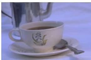
Taza de café

Mientras se va asando machacamos en el mortero unas hojas de perejil y un par de dientes de ajo, una vez bien macha-