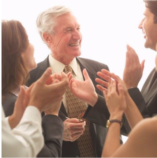
Aplauso en la prejubilación

Durante los últimos 6 meses, es decir desde marzo del presente año, todas las bolsas mundiales han presentado una fuerte revalorización, iniciada desde los mínimos históricos que se alcanzaron precisamente en dicho mes de marzo.