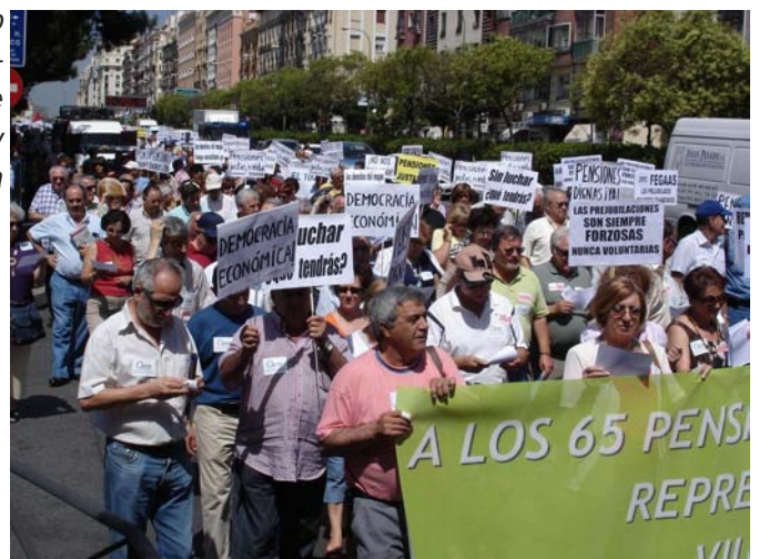
Cabecera de Femas en Madrid 17/06/2009.

“¿Terminaremos en el 5%? ¿Esto no hace peligrar el sistema de la S. Social Sr. Corbacho? Lo nuestro sí lo pone en peligro Sr. Ministro.”