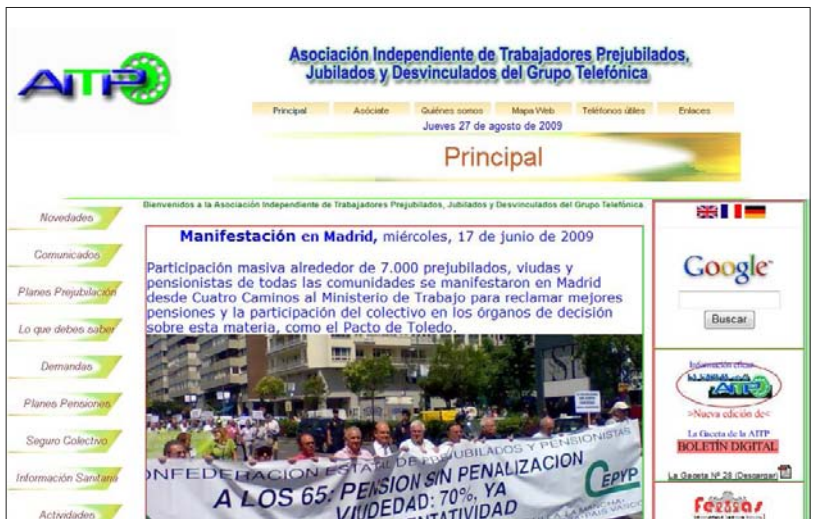
Página principal de nuestra Web con la manifestación de CEPYP en Madrid 17 de junio de 2009

Desde aquí os animo a todos a continuar trabajando con ilusión, para afrontar los nuevos retos que se nos presentan, con respecto a las TIC e invito a los que aún no forman parte de