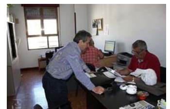
Sala de juntas AITP /A.Charro

La Junta Directiva de la A. I. T. P. os informa de la organización, con sus distintas áreas de trabajo y respectivos responsables. Recomendamos a todos los socios que dirijan sus preguntas a los correspondientes responsables por fax, e-mail o correo postal. Así os podremos atender mucho mejor.