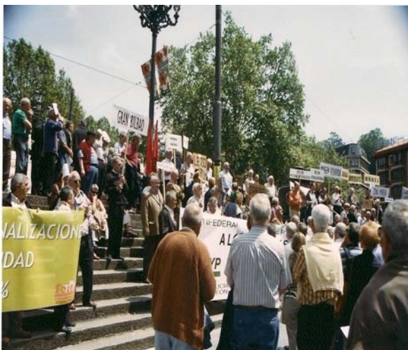
CEPYP en Bilbao 20 de mayo de 2009.