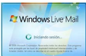
Correo de Microsoft