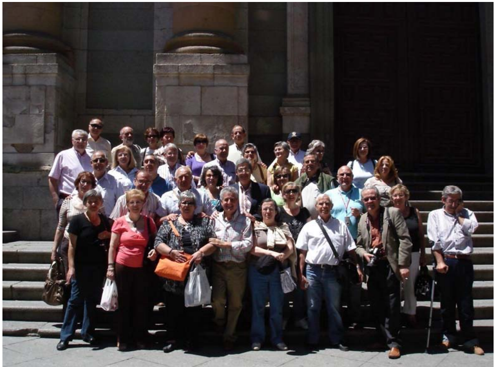
AITP frente a La Casa de las Conchas.

"Hemos de destacar que las visitas a las Catedrales fueron excepcionales. En la llamada Catedral vieja pudimos escuchar las estupendas explicaciones de nuestra guía, especialmente las relativas al retablo del altar mayor"