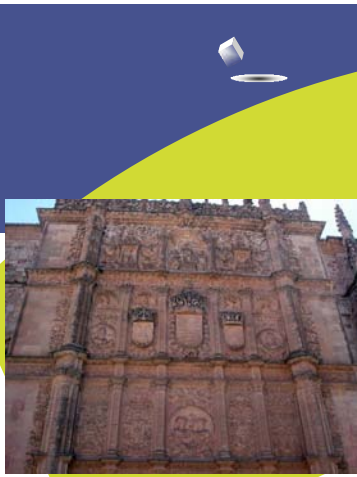
Universidad de Salamanca /Andrés Acosta González