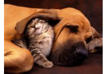
Perros y gatos en convivencia.

"El caballo le puede enseñar al ser humano control y fuerza física"