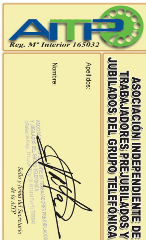
Carnet de socio